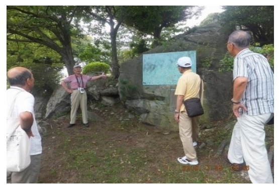
根本甲子男顕彰板がはめ込まれた花崗岩