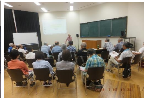
熱心に講話を聞く受講生