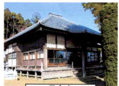
覚念寺 聖徳太子像