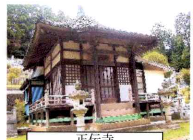
正伝寺 大窪郷統治の拠点