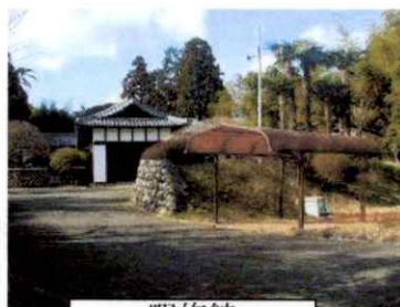
暇修館 水戸藩の郷校