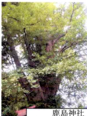
鹿島神社 駒つなぎのイチヨウ