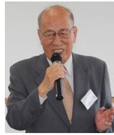
掛札 J-net 代表