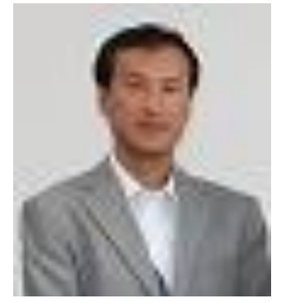
豊田社協事務局次長