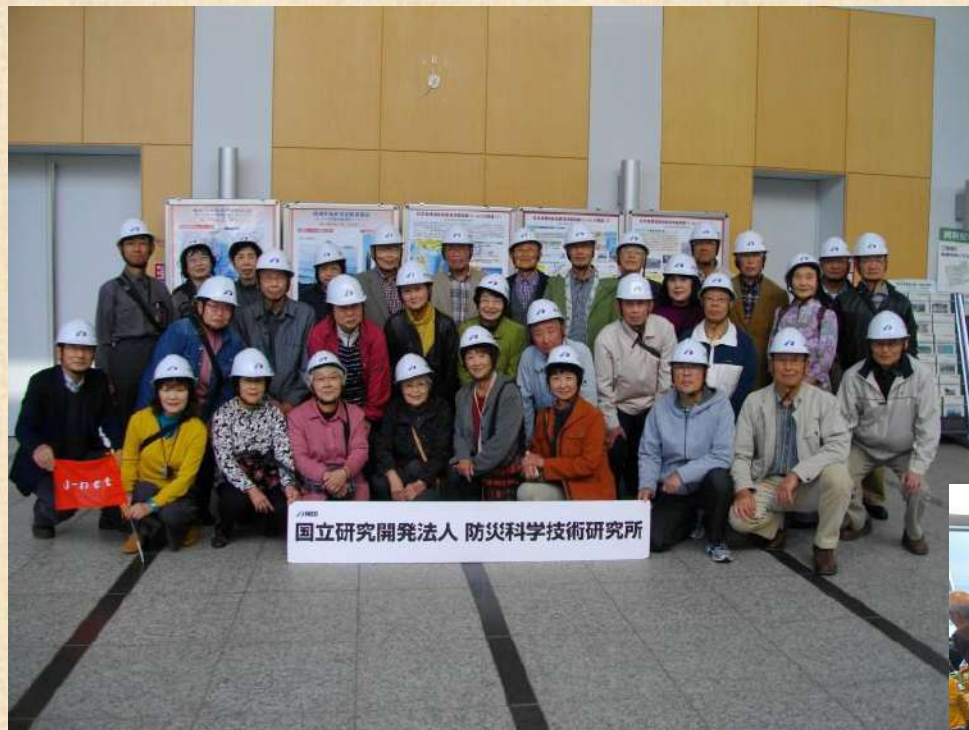
つくば防災科学研究所見学