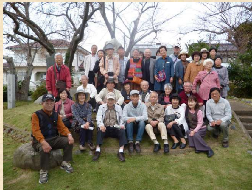
水戸八景 水門帰帆碑前で