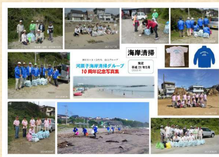
河原子海岸清掃Gr 10周年記念写真集