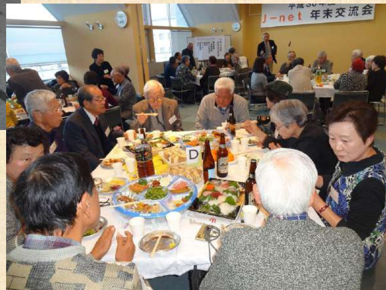
年末交流会（毎年恒例）