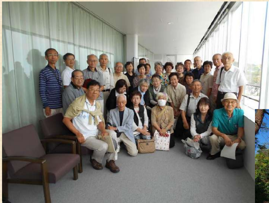
日立市議会見学・傍聴