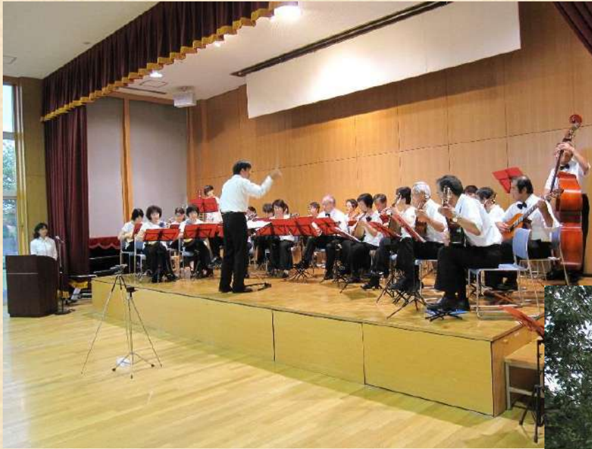
マンドリン演奏会鑑賞