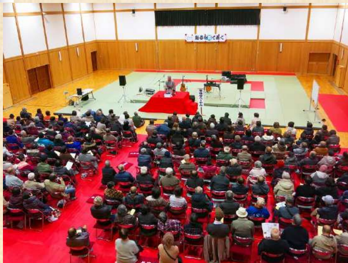
新春を和で寿ぐ at 共楽館