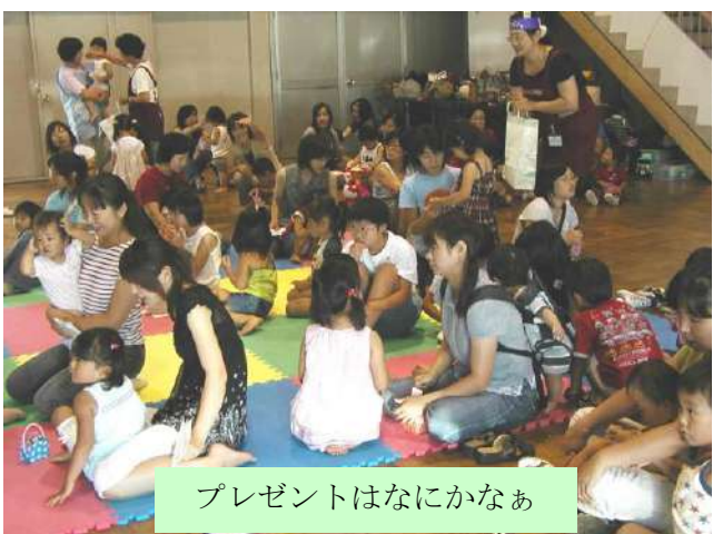
プレゼントはなにかなあ