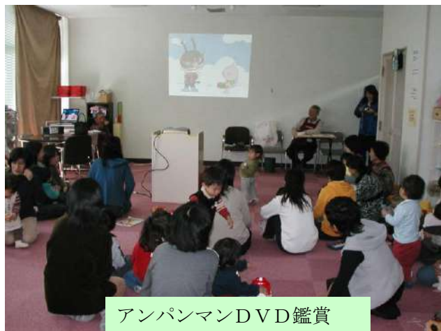
アンパンマンDVD鑑賞