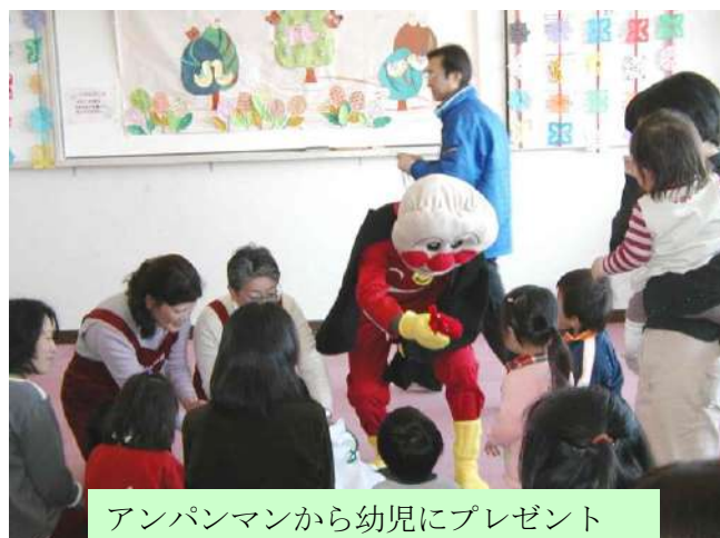
アンパンマンから幼児にプレゼント