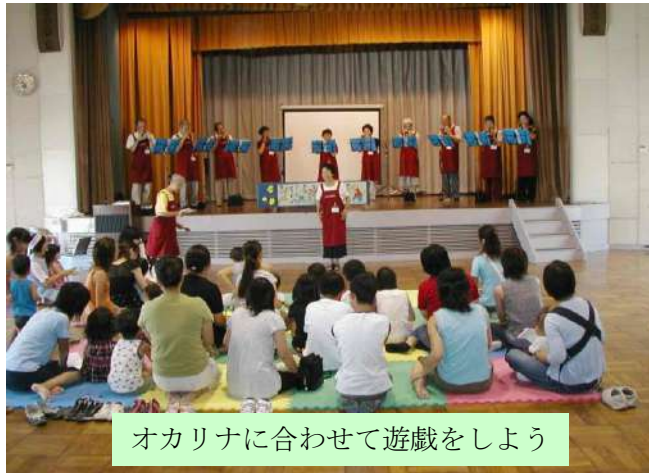
オカリナに合わせて遊戯をしよう