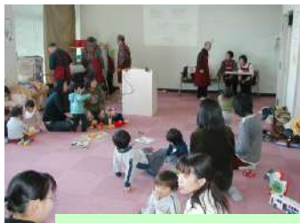
準備中のお客さん