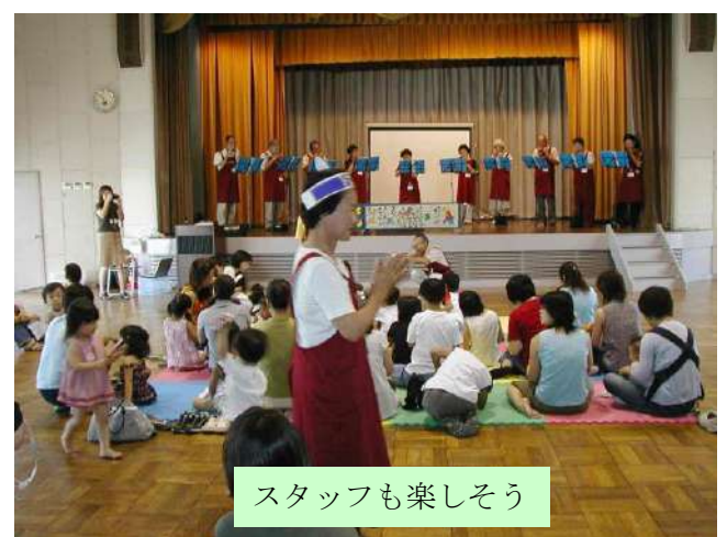
スタッフも楽しそう