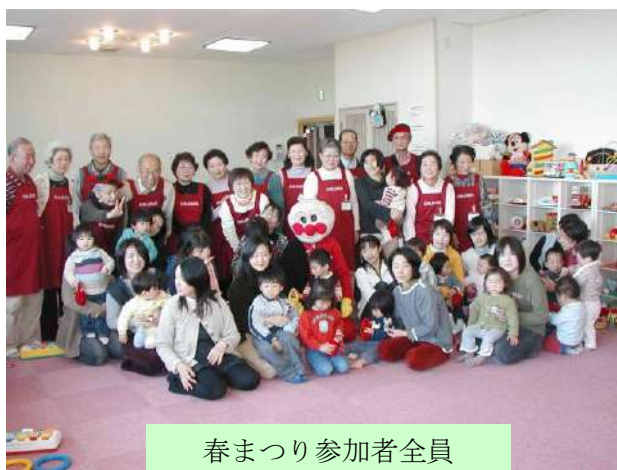
春まつり参加者全員