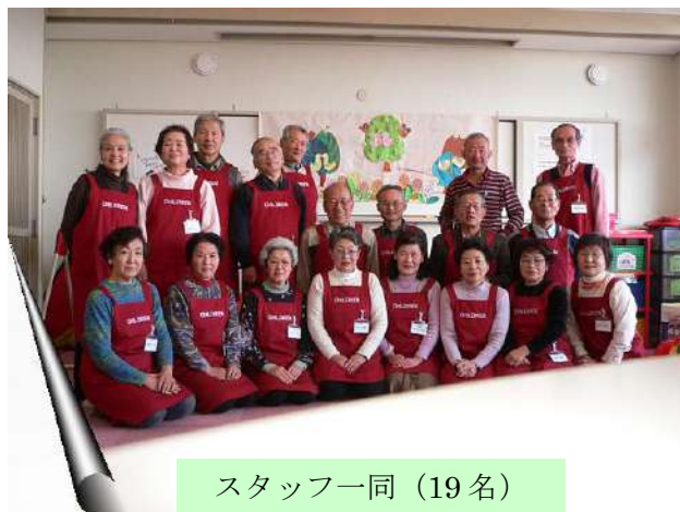
スタッフ一同 (19 名)