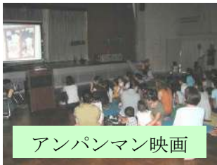
アンパンマン映画