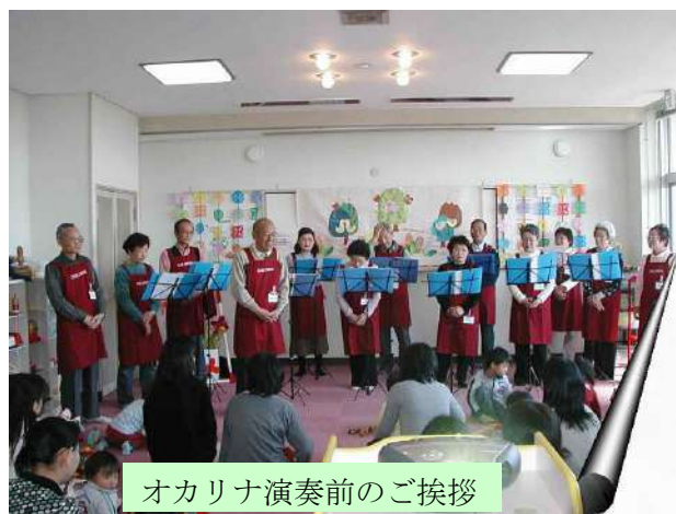
オカリナ演奏前のご挨拶