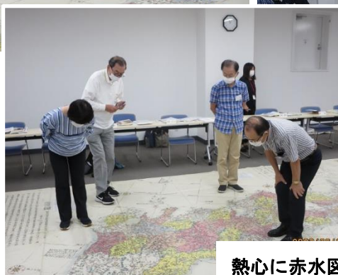
熱心に赤水図を覗く受講者